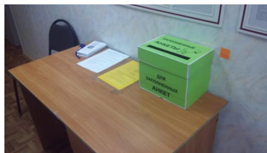
«Памятки антикоррупционного поведения», анкеты для граждан и ящик для заполненных анкет