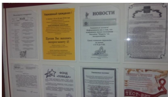
Объявление о проведении анкетирования граждан на информационном стенде